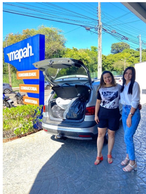
Figura 6: Doações entregues por alunos.