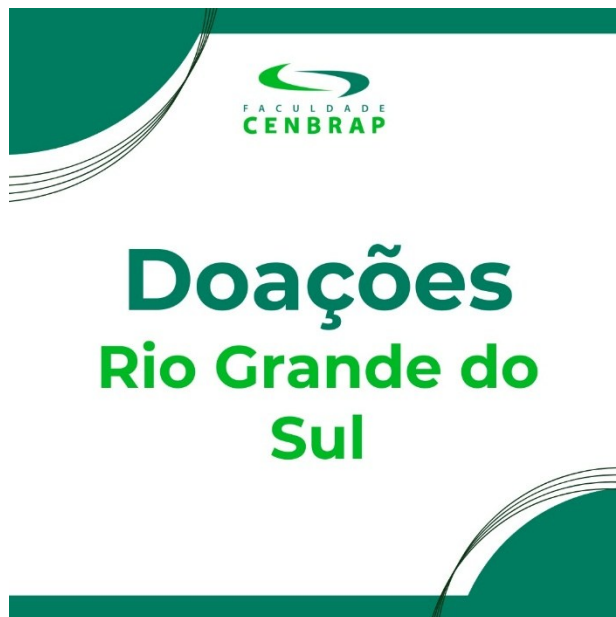
Figura 3: Divulgação da Campanha 2023 nas redes sociais