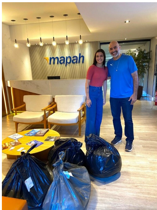
Figura 5: Doações entregues por colaboradores.