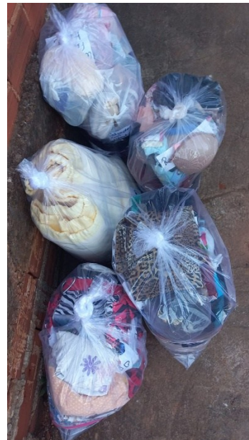
Figura 4: Doações entregues nos pontos de coleta.