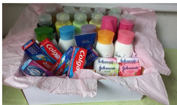
Figura 2: Doações arrecadadas e entregues ao Pronto Socorro Psiquiátrico Wassily Chuc

A outra campanha realizada em 2024 teve como enfoque a arrecadação de roupas e calçados novos e usados, destinados às famílias atingidas pelas enchentes no Rio Grande do Sul.